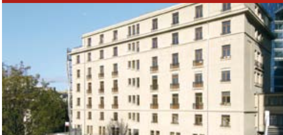
Etterbeeksesteenweg 62 - 1040 BRUSSEL