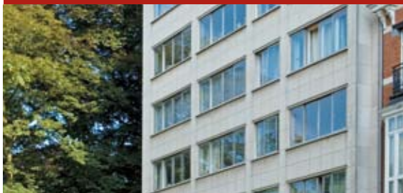
Winston Churchilllaan 157 - 1180 BRUSSEL