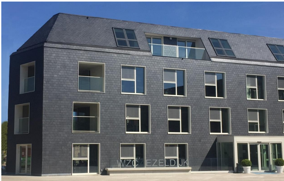
Ezeldijk – Diest