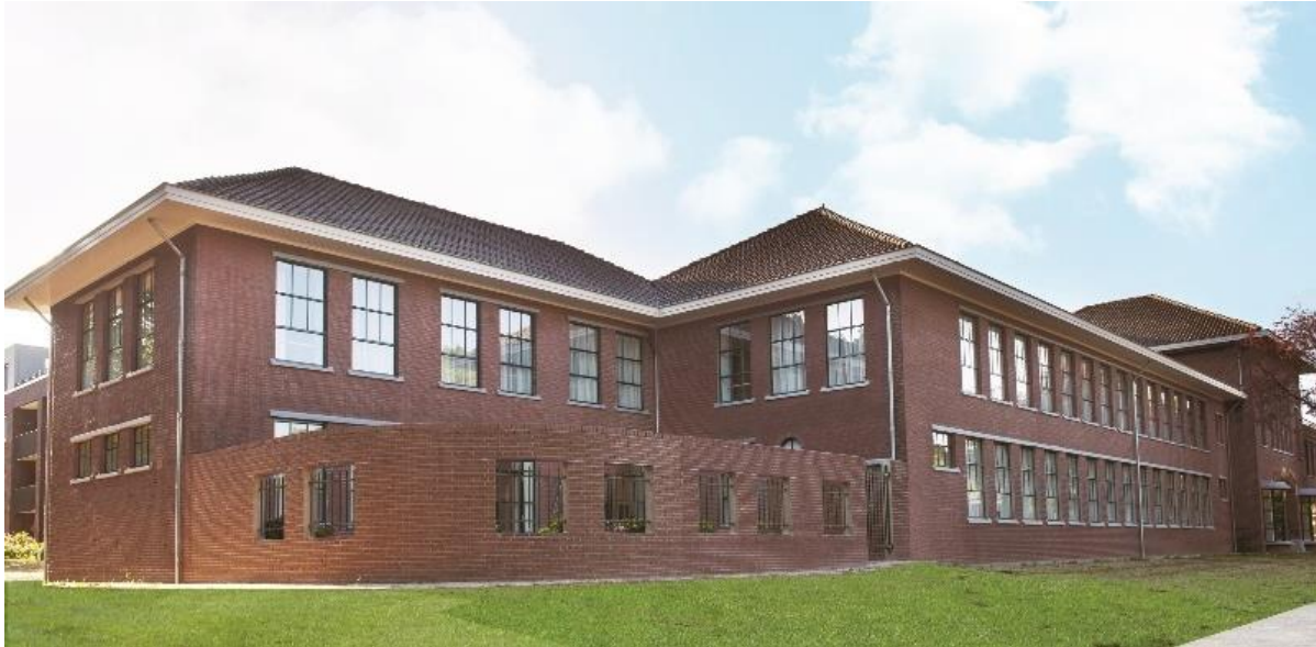
Saksen Weimar 1 - Arnhem

Aedifica meldt de acquisitie van een nieuwe site van huisvesting voor senioren in Nederland.